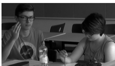
Abb. 3: Spanischunterricht, Tims Satzformulierung (00:17:36)

Für die Kontrastbildung wurde eine Lerngruppe Spanisch im zweiten Halbjahr der Qualifikationsphase eines Oberstufengymnasiums (zweites Lernjahr) ausgewählt.