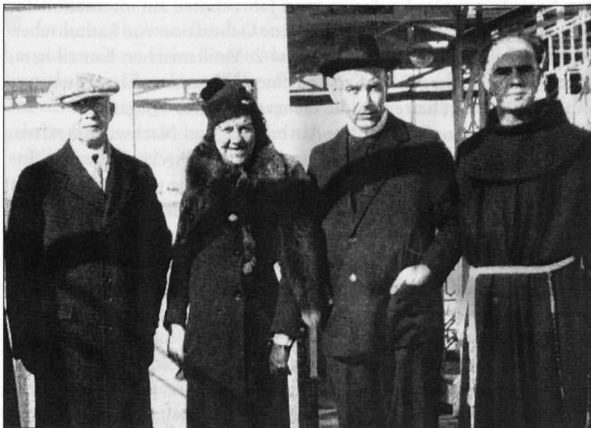
Pater Augustin Bea (2. von rechts) als damaliger Professor und Rektor des Bibel-instituts im Jahre 1936 unterwegs zu Ausgrabungen im Heiligen Land.

Auf der anderen Seite finde ich sie ausgesprochen ärgerlich. Denn gerade in unseren Jahren zeigt es sich, wie sehr Bea mit seiner Leidenschaft für Archäologie und Orientalistik recht hatte. Man hat ihm ja oft vorgeworfen, er hätte lieber biblische Theologie fördern sollen.