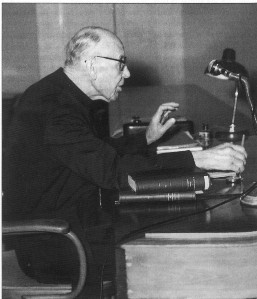
Professor Bea bei seiner letzten Vorlesung am Päpstlichen Bibelinstitut, mit der für ihn typischen sparsamen Gestik der Hand dozierend. Augustin Bea hielt diese Vorlesung über die Inspiration der heiligen Schrift am 5. Dezember 1959. Wenige Tage später wurde er zum Kardinal kreiert.

Er saß. Er sprach ruhig, die Gestik war nur im Zeigefinger. Sein Latein war perfekt, aber so einfach, daß jeder mitkam. Sein Vortrag war spannend, und zwar rein von der Sache her. Er war ein geborener Didakt. Wir waren hin und her gerissen zwischen der Lust, ihm zuzuhören, und dem Ärger über das, was er sagte. Denn was er sagte, empfanden wir als stockkonservativ.