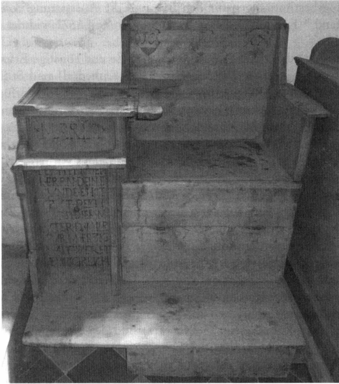
Abb. 4: Beichtstuhl in der Kirche St. Lorenzen ob Murau, 1607

Neben den exemplarisch erläuterten frühen Beichtstühlen in mittelalterlichen und frühneuzeitlichen Kirchen bestanden seit dem Mittelalter – vor allem in südeuropäischen Kirchen – auch so genannte Beichtnischen, Beichtkammern oder Beichtfenster. Vereinzelt waren dabei Beichtvater und Pönitent bereits durch ein Gitter voneinander getrennt, wodurch die Handauflegung bei der Absolution verunmöglicht wurde. Das warf zwischenzeitlich die Frage auf, ob dieses Element nicht zum Wesen des Sakramentes gehöre und deshalb unverzichtbar sei. Im Laufe des Mittelalters ersetzte jedoch das Kreuzzeichen die Geste der Handauflegung des Priesters bei der Absolution. 24