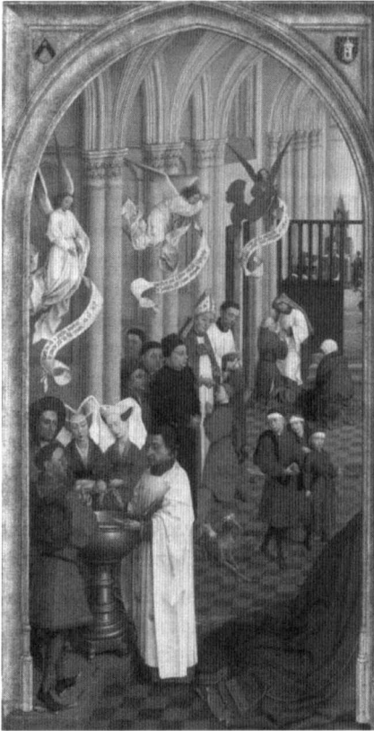
Abb. 2: Linke Tafel des Triptychons „Altar der sieben Sakramente“, 1445

Eine zweite frühe und bedeutende Darstellung eines (spät-)mittelalterlichen Kirchen- oder Beichtstuhls bietet das um 1445 entstandene Triptychon mit dem Titel „Altar der sieben Sakramente“ des flämischen Malers Rogier van der Weyden (1399/1400-1464). Die linke Tafel dieses Meisterwerkes der Altniederländischen Malerei stellt im Seitenschiff einer gotischen Kirche die Feiern von Taufe, Firmung und Buße dar. Wie schon auf der Miniatur im älteren Mailänder Stundenbuch sitzt der Spender des Bußsakramentes auch in diesem Fall auf einem repräsentativen hölzernen Armlehnstuhl, dem hier allerdings ein kleines Holzpodest vorgelagert ist. Auf diesem Podest kniet der Pönitent. Der Stuhl steht hier vor einer Rückwand, die den Chorraum vom Langhaus der Kirche trennt. 21 So wird die Beichte in einem Raumteil außerhalb des Presbyteriums verortet, der allen Gläubigen zugänglich ist. Da der Stuhl in die Stufenanlage eingelassen ist (siehe Detailansicht), kann er als feststehender liturgischer Ort bzw. Einrichtungsgegenstand in diesem Kirchenraum gesehen werden, der offensichtlich nicht nur temporär aufgestellt wurde.