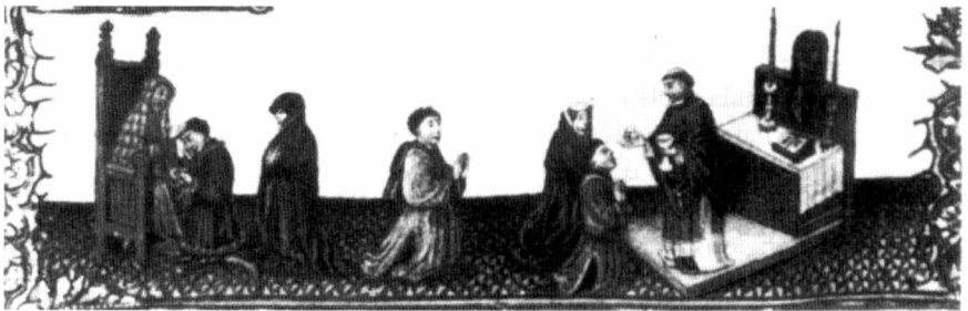
Abb. 1: Miniatur aus dem Mailänder Stundenbuch, 1416

In seiner heutigen Form geht der Beichtstuhl auf den mittelalterlichen Kirchenstuhl zurück, den Abbildungen ab dem 15. Jahrhundert als mächtigen hölzernen Armlehnstuhl zeigen. Ein frühes Beispiel dafür ist eine Miniatur im Mailänder Stundenbuch von 1416, auf der Beichte und Kommunion dargestellt sind. Der Spender des Bußsakramentes sitzt hier auf einem großen Armlehnstuhl mit hoher Rückenlehne, die zwei fialenartige Abschlüsse aufweist, und legt einem davor am Boden knienden Pönitent die Hand auf.