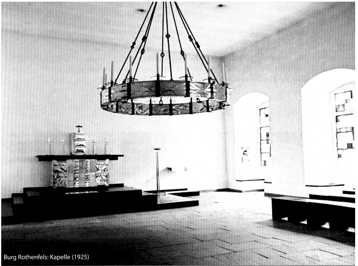
Burg Rothenfels: Kapelle (1925)