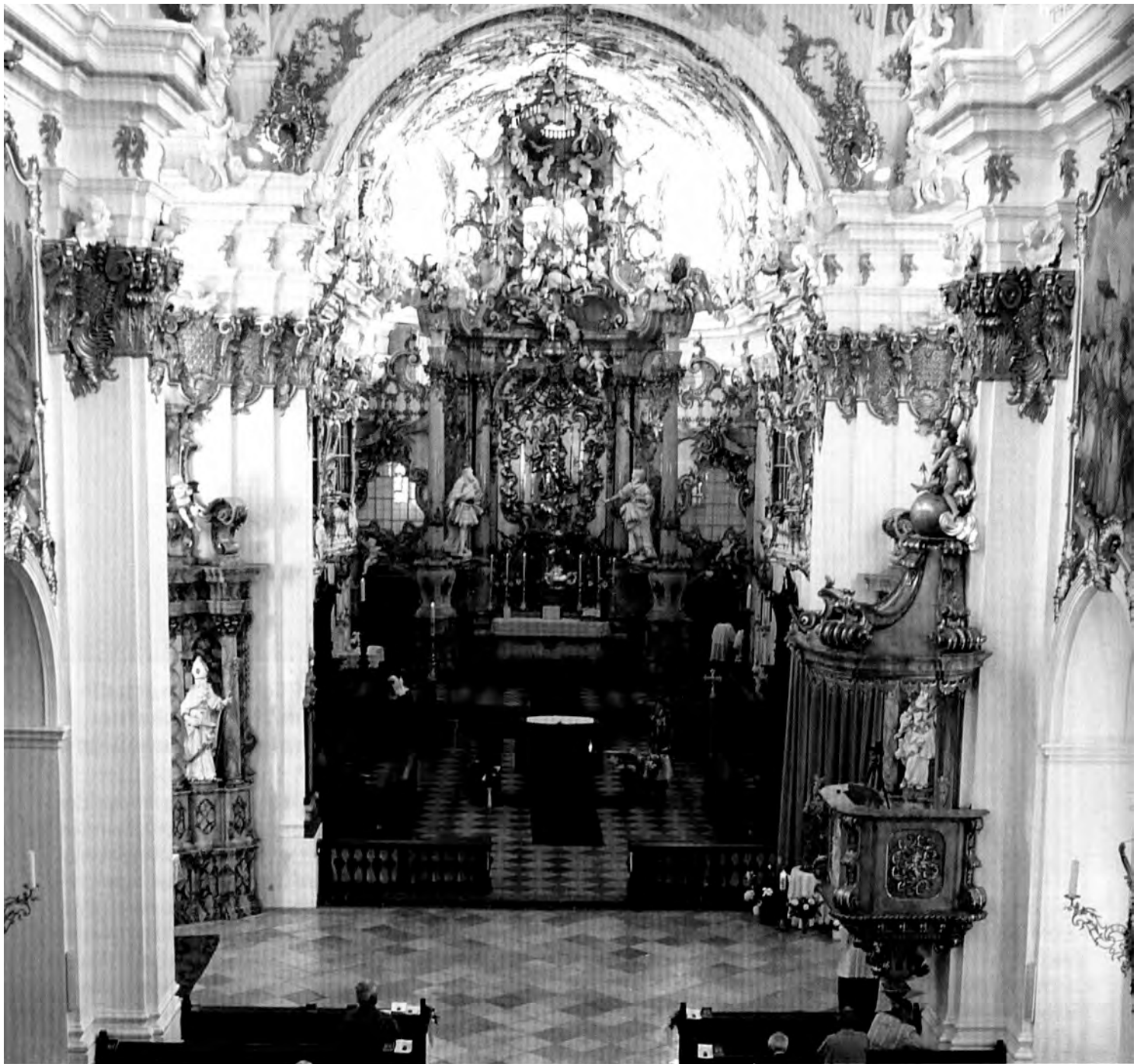
Alte Kapelle in Regensburg

lichkeit sucht. Da ist die leider sehr verkannte allegorische Meßfrömmigkeit; sie verbindet das heilige Geschehen mit der Heilsgeschichte des Alten und des Neuen Testaments oder mit dem Leben oder der Passion Christi. Es läßt sich zeigen, daß all diese Formen einer zeitgenössischen offenen Ästhetik des Spielens mit Bedeutungen und des Wechsels zwischen Sinnebenen dem christlichen Gottesdienst sehr viel mehr entsprechen als die platt-lehrhafte Liturgiedidaktik eines „Das bedeutet folgenden Gedanken...“