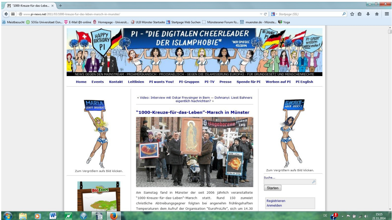
Abb. 2: PI-Screenshot (21.11.2014) mit Werbung mit dem NPD-Slogan „Maria statt Scharia“; zugleich abgebildet ein Bericht über den „1000-Kreuz-Marsch“ 2011 in Münster.