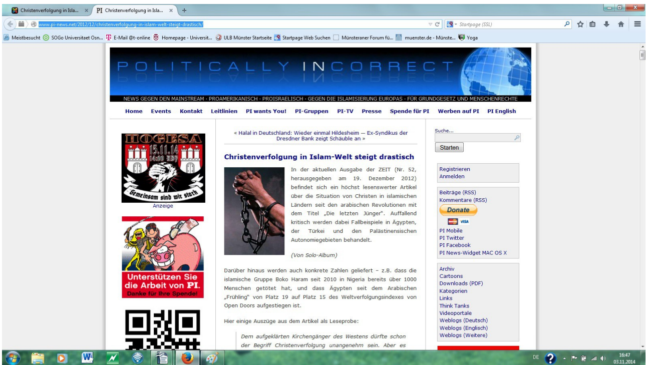
Abb. 3: PI-Screenshot (3.11.2014) mit HoGeSa-Werbung und Verzweckung des Themas Christenverfolgungen für antimuslimischen Rassismus.