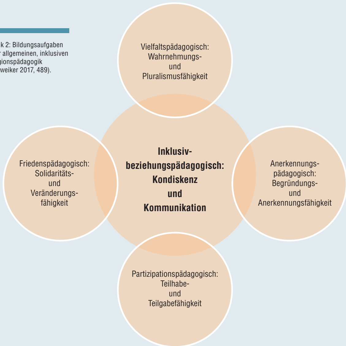
Grafik 2: Bildungsaufgaben einer allgemeinen, inklusiven Religionspädagogik (Schweiker 2017, 489).

Aus diesen zentralen Begriffspaaren ergeben sich Grundsätze des Inklusionsprinzips, die hier nicht eigens ausgeführt werden können (ebd. 430ff) und religionspädagogische