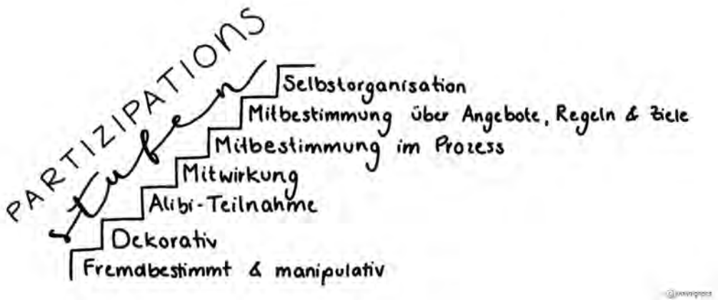
Abbildung 1: Partizipationsstufen nach Scherr und Sachs (2015), Grafik: Judith Gross

Dieses Schema wurde im vorliegenden Praxisforschungsprojekt als Analysefolie über die empirisch untersuchten Lokalprojekte gelegt, um Chancen und Entwicklungsmöglichkeiten für eine verstärkte Partizipation zu identifizieren. Der Rahmen dieses wissenschaftlichen Begleitprojekts soll im Folgenden umrissen werden.