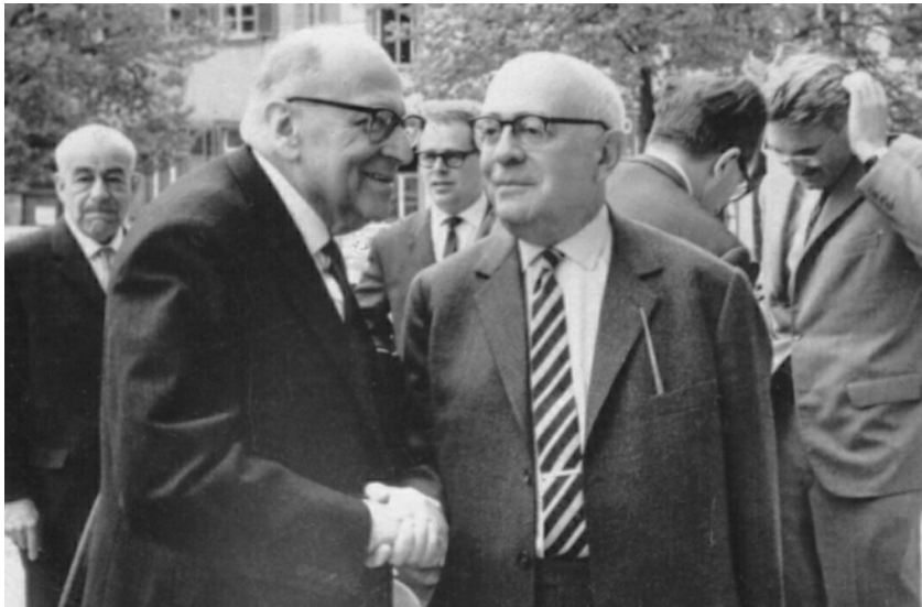
Max Horkheimer (vorne links), Theodor W. Adorno (vorne rechts) und Jürgen Habermas (im Hintergrund rechts) im Jahr 1964 in Heidelberg.