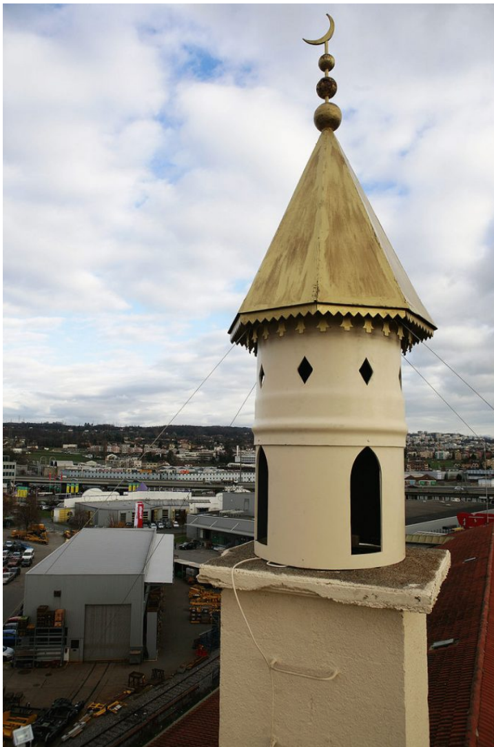
Linke bauen Minarette? Dieses Karton-Minarett stand vorübergehend im Schweizer Bussigny-près-Lausanne als Protest gegen die Volksinitiative für ein Minarettverbot (November 2009).