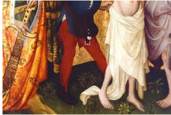
Dieses Bild findet sich auf verschiedenen Webseiten zum Thema Hexenverfolgung als Bildbeleg für den Einsatz der Folter durch die Inquisition. Die abgebildete Malerei aus dem frühen 15. Jh. zeigt tatsächlich das Martyrium der Hl. Agatha von Catania (250 u.Z.).

Das Bild der Hexe lebt bis in die Gegenwart weiter (vgl. Märchen und Magie zwischen Wirklichkeit und Fiktion. Eine Kritik ). Was lässt sich von den beschriebenen Stereotypen wiederfinden?