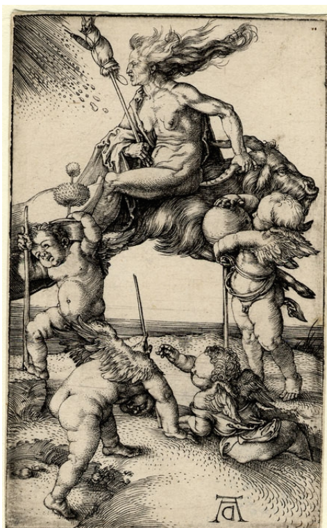
Druck von Albrecht Dürer um 1500: Eine Hexe reitet rückwärts auf einer Ziege.

Bild des British Museum , Nr. 1868,0822.188, unter Creative Commons Lizenz CC BY-NC-SA 4.0 .