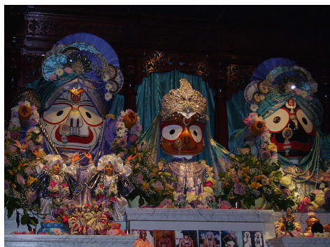
"Altar" des ISKCON-Tempels in Berlin.