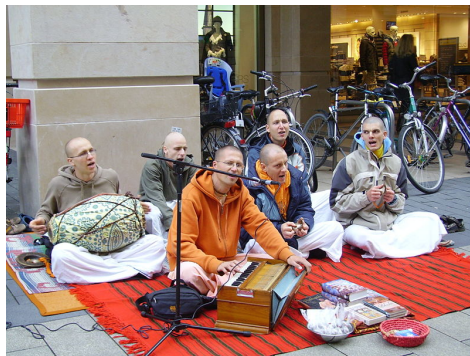
Hare Krishna Devotees in Leipzig 2007.