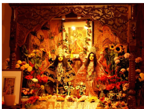
Altar im Bhakti Yoga Zentrum Bochum mit Bildgestalten von Sri Gaura-Nitai, Nov. 2013.