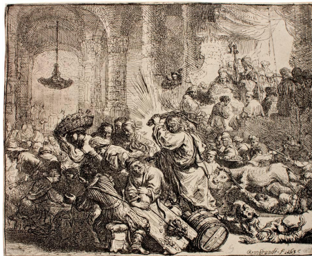
Der Begründer des Christentums war ein Nonkonformist, der seinem Unbehagen auch mit Gewalt Ausdruck verlieh. (Rembrandt Harmenszoon van Rijn: Jesus vertreibt die Händler aus dem Tempel , 1635, Radierung, ehem. Sammlung J. de Bruijn, heute Connecticut College Wetmore Print Collection).

Der Radikale Pietismus ist ein gutes Beispiel. Im ausgehenden 17. und frühen 18. Jahrhundert gab es an vielen Orten in Europa und Nordamerika Personen und Gruppen, die eigene Antworten auf für sie drängende religiöse Fragen fanden. Bei den Trägern dieser Bewegung (wobei ich nicht sicher bin, ob man von einer Bewegung sprechen kann) finden wir all die Merkmale, die ich gerade angesprochen habe: Eine starke Religiosität, d.h. eine allumfassende Vorstellung davon, wie die Welt beschaffen sei, die dann, wenn sie in Konflikt mit den Ansprüchen der Kirche gerät, eben nicht zurückgestellt wird. Um es konkret zu machen: Die radikalen Pietisten haben sich den Vorgaben der Kirche widersetzt, wo es nur ging, weil sie die Kirche und ihre Vertreter für völlig korrupt hielten. Man mied den Gottesdienst, vor allem nahm man nicht am Abendmahl teil. Manche ließen ihre Kinder nicht taufen. Das allein war schon unerhört und wurde streng geahndet.