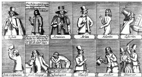
Einen Eindruck von der Vielfalt des Nonkonformismus im England der Bürgerkriegszeit vermittelt dieser Einblatt-Druck aus dem 17. Jh.: Die Jesuiten stehen an erster Stelle. Aus: A Catalogue of the Sevalll Sects and Opinions in England and other Nations: With a briefe Rehearsall of their false and dangerous Tenents . London: R.A., 1647. (Klicken Sie zur Vergrößerung auf das Bild).

Vielleicht kann man das an zwei Beispielen festmachen? Nehmen wir den radikalen Pietismus und auf der anderen Seite die sogenannten Neuen Religionen.