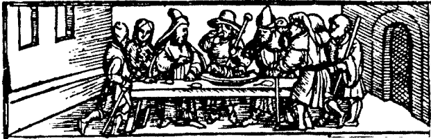
Abb. 3 78

Die Vorlage für das Bildprogramm liefert offensichtlich der Erste Korintherbrief. 76 Zumindest sind die Parallelen der Motive auffällig. 1 Kor 11,17-34 ist die Belegstelle für die Auffassung des Abendmahls als einer geistlichen im Gegensatz zu einer fleischlichen Speise, die ohne Rücksicht auf die Gemeinschaft genossen wird. Die geistliche Speise ist ein Schlüsselbegriff in Zwinglis Argumentation. Ein unbedachter Genuss der Kommunion, die nicht auf den Sinn und Geist achtet, wandelt die geistliche Speise in etwas Verderbliches. Gemäß Zwinglis Formular ist deshalb in jeder Mahlfeier die ganze Perikope 1 Kor 11,17-34 (als Ermahnung) zu lesen. Die Mahlfeier des Herrn gibt es nur mit dieser „Packungsbeilage“ – der Warnung, dass ein unwürdiger Verzehr aus der Gabe ein Gift macht. 77