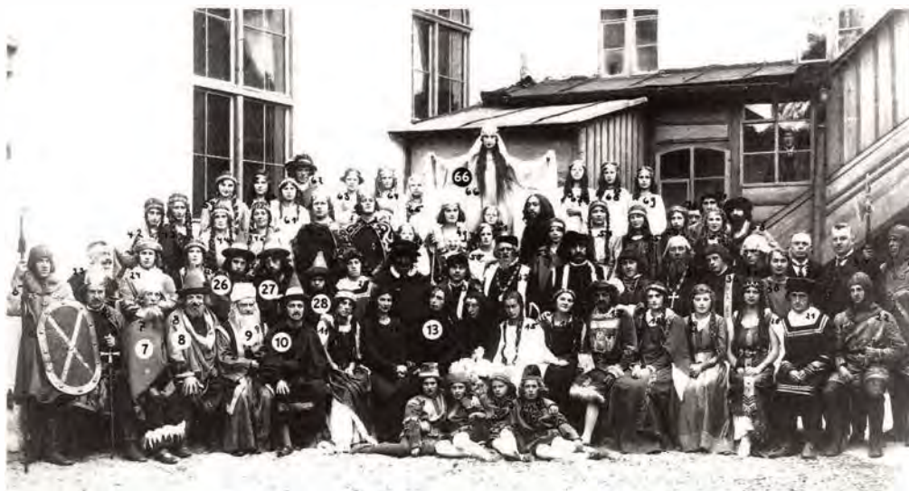
Die Mitwirkenden eines in den Jahren 1925/26 in Deggendorfer aufgeführten »Gnad«-Spiels, darunter »Juden« in mit eucharistischer Tracht und z. T. mit aufliegenden Hakenmasken (Nr. 7-10, 26-28), der Teufel (Nr. 13) und die Gottesmutter Maria (Nr. 66)

wirtschaftlichen Gründen (Schulden, Mißerte) ermordet. Im Laufe der darauffolgenden Jahre begann man – nunmehr in einer finanziell günstigeren Situation – mit dem Bau einer geräumigen Kirche innerhalb der Stadtmauer, die einem seelsorglichen Bedürfnis entsprach. Das Gotteshaus, das sich 1361 in Bau befand, konnte noch vor der Jahrhundertwende im wesentlichen fertiggestellt werden. Die Kirche erhielt zwei im Mittelalter sehr häufige Patronen, indem sie den Apostelfürsten Petrus und Paulus sowie dem Leibe Christi geweiht wurde. Letzteres deutet keineswegs auf eine verübte Hostienschändung, sondern vielmehr auf ein hier errichtetes Heiliges Grab hin, das zusammen mit der »Imago pietatis« – dem Schmerzensmann – Objekt einer ausgeprägten Passionsfrömmigkeit war und der in verschiedener Hinsicht nach Jerusalem weisenden Filialkirche den schon im 14. Jahrhundert gebräuchlichen Namen »Hl. Grabkirche« verlieh.