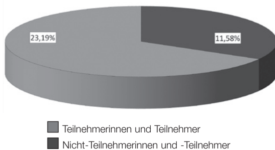
Abbildung 2 Übergänge in Ausbildung

Betrachten wir in einem ersten Schritt die Übergänge in eine berufliche Ausbildung (i.d.R. im dualen System):