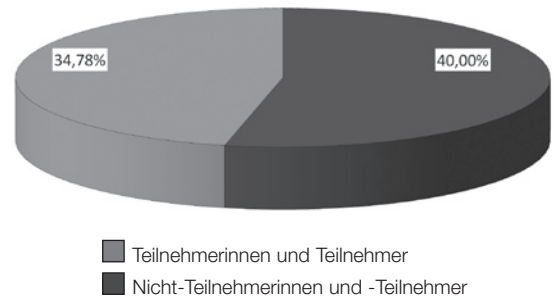
Abbildung 4 Übergänge in weiterführende Schulen

Während bei der Zielsetzung des Projektes „Freunde schaffen Erfolg“ die Übergänge in das duale Ausbildungssystem bzw. in berufsvorbereitende Maßnahmen fokussiert wurden, zeichnete sich unter den Projektteilnehmerinnen und -teilnehmern ein Trend hin zu schulischer Höherqualifizierung ab. Der Besuch einer weiterführenden Schule wurde von vielen Schülerinnen und Schülern – sowohl aus der Rosensteinschule als auch aus der Lerchenrainschule – angestrebt, um einen höheren als den Hauptschulabschluss zu erwerben. Dies ist deckungsgleich mit einem allgemeinen Trend: Der Übergang in eine weiterführende schulische Bildungssequenz gilt gesellschaftlich längst nicht mehr als Notlösung und wird daher von den jungen Menschen als Möglichkeit einer Chancenverbesserung auf dem Ausbildungsmarkt gewertet (vgl. Gaupp/Lex/Reißig/Braun 2008). Dass sich dies auch im vorliegenden Sample so ausdrückt, zeigen die Übergangszahlen im Vergleich: