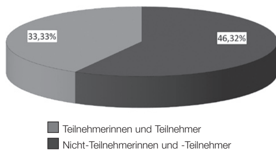
Abbildung 3 Übergänge in berufsqualifizierende Maßnahmen

Ein weiteres wichtiges Projektziel bestand in der Erwartung, die Zahl der Übergänge in die sogenannten berufsqualifizierenden Maßnahmen des BVJ, BEJ und BVB abzusenken: